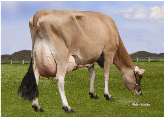
LUCKY HILL JOKER WABORITA FOURTH DAM